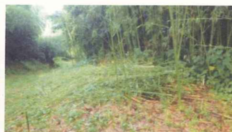
伐った竹をまとめておく