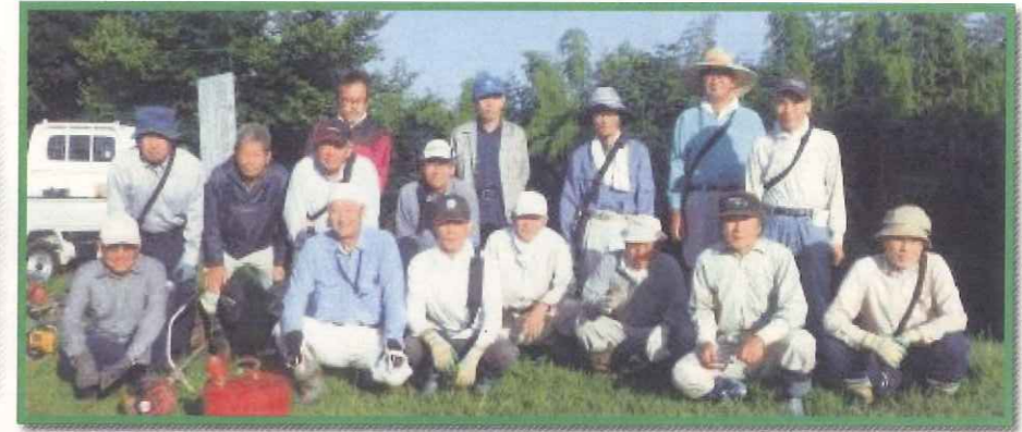
会員のみさんの集合写真(取材日)